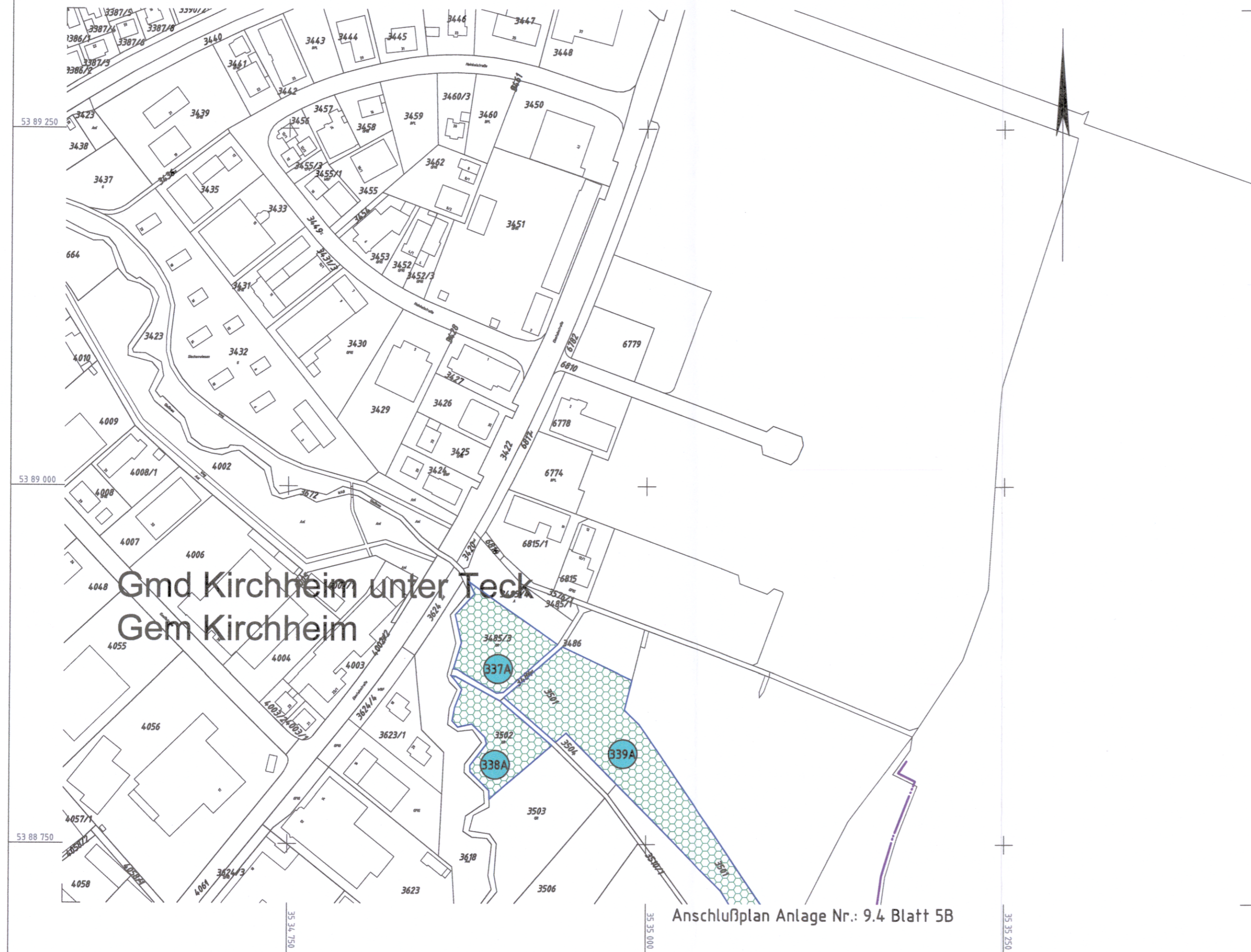
Anschlußplan Anlage Nr.: 9.4 Blatt 5B